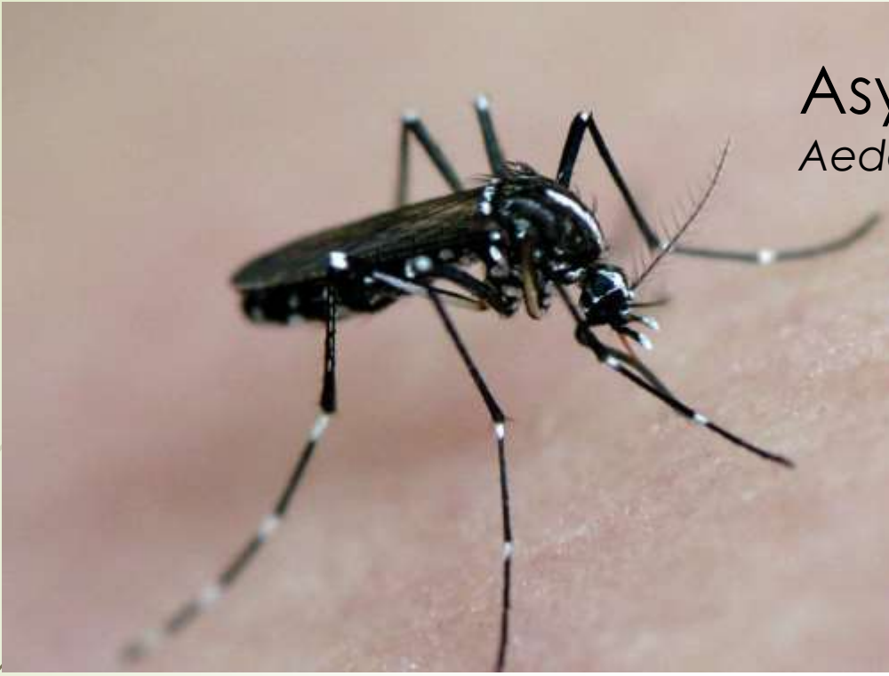
Asya Kaplan Sivrisineđi Aedes albapictus

Tehlikeli hastalık mikropları taşıyabilen bu siyah sivrisinekler Adalar'da ilk 2017'de görülüp, 2018'de iyice yerleştiler