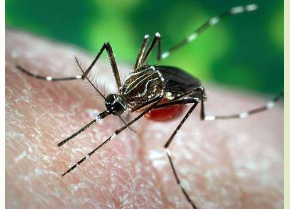
Sarı Humma Sivrisineđi Aedes aegypti (kan emmiş, karnı o nedenle kırmızı!)

Tehlikeli hastalık mikropları taşıyabilen bu siyah sivrisinekler Adalar'da ilk 2017'de görülüp, 2018'de iyice yerleştiler